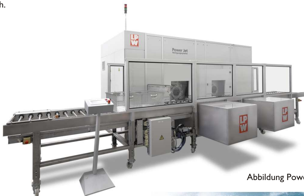
Abbildung PowerJet 670Twin

Sondergrößen für große Gewichte (Baureihe "heavy duty") oder außergewöhnliche Abmessungen sind jederzeit möglich.